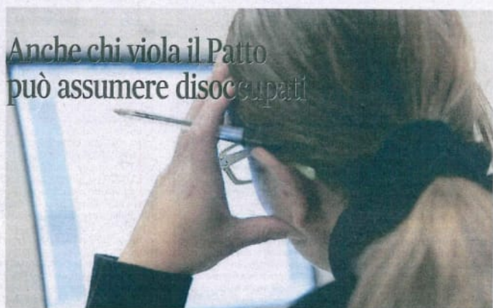
TRIESTE Una sentenza della Corte dei conti ha stabilito il principio

Sentenza La Corte dei conti si è espressa sul caso di un Comune