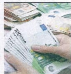
SOLDI Ricerca sui pagamenti